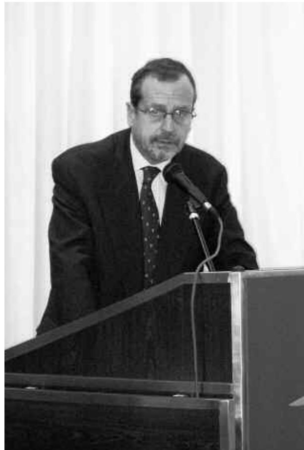
Patrick Gautrat 'Ambassadeur de France

« De bons résultats ont été obtenus grâce au travail des experts et à l'étroite collaboration avec les responsables polonais du projet. Le dernier recensement agricole a montré que le nombre d'exploitations agricoles en Pologne restait stable (environ 2 millions), donc important, et que le nombre des exploitations les plus petites augmentait même. Le but est que le nombre de ces dernières exploitations diminuent au profit des exploitations viables, qui produisent pour commercialiser et non pour satisfaire des besoins propres, comme c'est le cas actuellement pour plus de 50 % des exploitations. Le gouvernement polonais, qui est conscient de l'importance de cette mesure, a pris la décision de transférer une partie des fonds des autres mesures vers la préretraite agricole en doublant le budget affecté dans les projets précédents ».