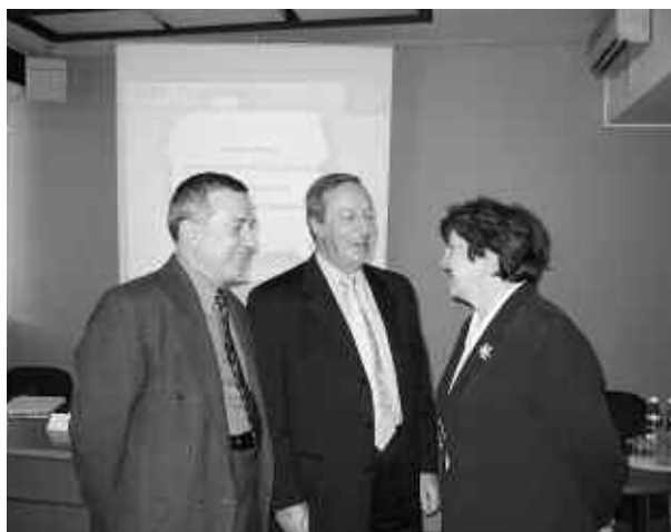
Des débats en Pologne

Au niveau national, la Krus aura alors acquis une compétence dans le champ de l'action sociale en prouvant sa capacité à s'inscrire dans une démarche de développement social local...»