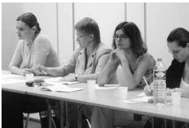
Des polonais lors d'un bilan de voyage d'étude en France

Ils expriment un sentiment de frustration d'en être resté au lancement du système et "n'avoir pu aller jusqu'au stade de la réalisation complète" et s'accordent à souhaiter "la création d'une structure spécifique professionnalisant les activités de coopération internationale"