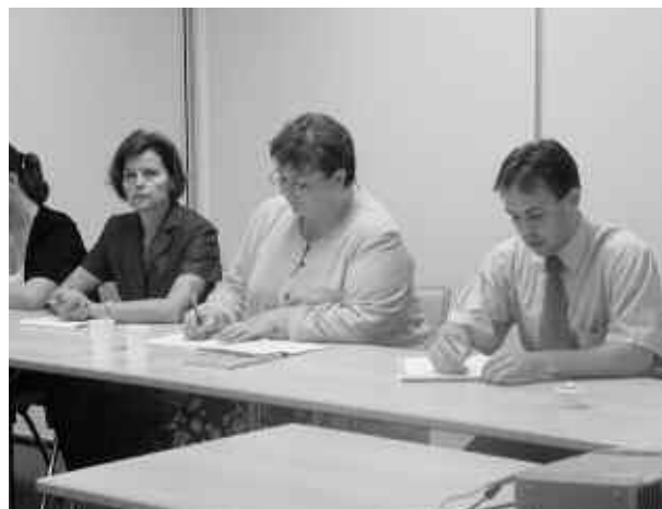
Des polonais lors d'un bilan de voyage d'étude en France

Cette analyse socio-économique a motivé l'engagement de la MSA en Pologne, pour la mise en place d'un système de préretraite et la gestion de ses impacts.