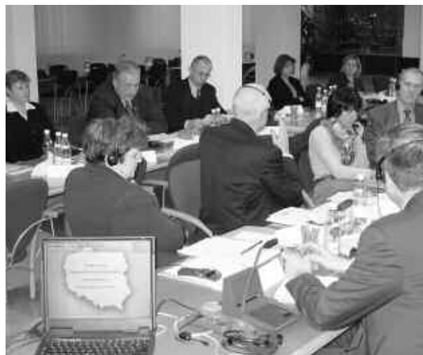
Les groupes de travail

En raison des conséquences prévisibles de la mutation de l'agriculture sur le milieu rural (concentration des exploitations, réduction de la main-d'œuvre – notamment la plus âgée), les deux organismes ont en outre lancé un programme expérimental de développement social local sur cinq territoires. Il s'agit d'accompagner 5 caisses régionales et 5 agences locales de la Krus pour la mise en place de nouveaux services, en faveur notamment des agriculteurs en difficulté, de la population âgée et des personnes handicapées.