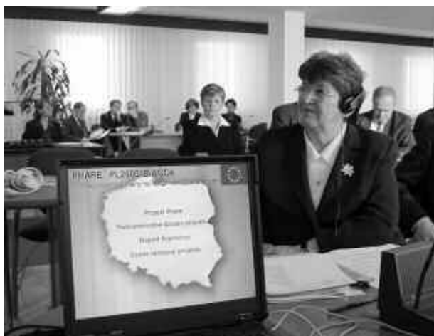
Une opération Phare!

Mais les attentes sont fortes et il faudra évaluer précisément la démarche en affinant les objectifs (public ciblé, indicateurs chiffrés) de chacune des actions et le seuil à partir duquel les bénéficiaires, la Krus, mais aussi ses partenaires estimeront être satisfait des résultats atteints... »