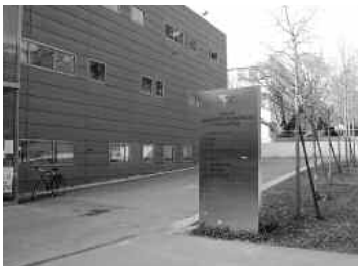
Une partie de la façade de la faculté de sciences économique et de gestion

En septembre, chaque étudiant présente son travail devant un jury dans le lequel siège le maître de stage et l'enseignant-tuteur.