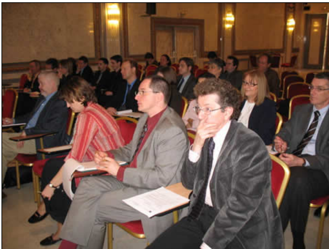
Une vue de la salle

Le montant de la cotisation à l'association est inchangé.